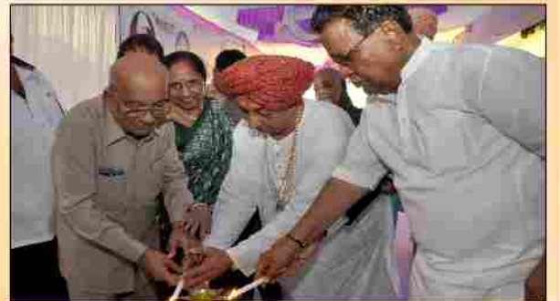
નામકરણ વિધિ સમારોહ પ્રસંગે મંચસ્થ મહાનુભાવો